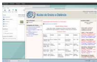
Figura 5. AVA Moodle acesso EyeOS 1.9.0.3 Figura 6. AVA Moodle acesso EyeOS 2.5

Conforme ilustrado na Figura 5 ( EyeOS 1.9.0.3 ), o usuário irá acessar o sistema EyeOS efetuando o login e senha. Após, o mesmo deverá abrir o AVA Moodle para acessar sua disciplina por meio do Repositório Applications integrante do EyeOS onde localiza-se o aplicativo EyeMoodle . A Figura 6 representa o AVA Moodle integrado ao EyeOS 2.5 , primeiramente foi criado um grupo (ferramenta Grupos – sistema EyeOS ) no qual disponibiliza-se o link para acesso ao AVA Moodle , como também documentos compartilhados entre os integrantes.