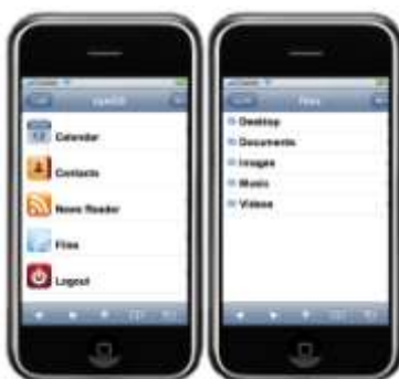
Figura 4. EyeOS acessado via dispositivo móvel

Segundo Gagné (2010), as vantagens do sistema EyeOS são evidentes. Além de poder ser utilizado dentro de empresas em seus sistemas privados, pode ser utilizado em escolas e sistemas de ensino à distância uma vez que possibilita a modificação e adaptação de todo o sistema por ter seu código aberto. No caso de uma escola, por exemplo, poderia ser criado um desktop diferente para alunos e professores. Seguindo o conceito de Cloud , tudo é acessado por um browser e fica disponível a qualquer momento e em qualquer lugar para todos os usuários, necessitando apenas de uma conexão com a internet para que se possa usufruir do mesmo. Para que um administrador instale o sistema e o disponibilize para demais usuários, é requerido pelo sistema um servidor web compatível com PHP5 além de algumas outras dependências.