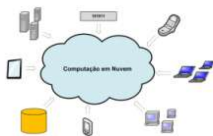
Figura 1. Visão Geral de uma Nuvem Computacional

Diversos fatores são apontados como vantagens da utilização das nuvens em relação ao modelo de computação clássico a que está-se acostumado, onde hardware e software são adquiridos e utilizados localmente. O autor Franke (2010) destaca as seguintes vantagens: portabilidade de documentos, aumento no poder de aplicações, Plataforma independente e Facilidade de abstração. Além das vantagens citadas, existe o fato de uma maior facilidade de adaptação para diferentes dispositivos que estejam acessando a aplicação cloud . Essa característica pode ser muito útil considerando a constante mudança nos padrões e maneiras de utilizar informática. Pode ser observada certa simplificação de interfaces, modificações na interação entre usuário e máquina e ainda diminuição e integração de equipamentos, um exemplo é a atual ascensão dos smartphones e tablets . A Figura 1 ilustra diferentes tipos de dispositivos acessando determinada aplicação em cloud .